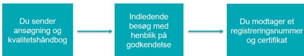
Figur 6.1 Trin for trin godkendelsesproces for træemballagevirksomheder

Når eventuelle afvigelser er korrigeret, kan virksomheden godkendes, idet Styrelsen for Fødevarer, Landbrug og Fiskeri udskriver et certifikat og tildeler et unikt registreringsnummer. Registreringsnummeret er gyldigt, indtil virksomheden afmeldes ordningen, eller hvis Styrelsen for Fødevarer, Landbrug og Fiskeri opdager alvorlige afvigelser ved et kontrolbesøg. Registreringsnummeret skal indgå i det unikke ISPM-15 mærke. Herefter har den godkendte virksomhed ret til at mærke træ og træemballage, der opfylder kravene i standarden, med virksomhedens unikke ISPM-15 mærke.